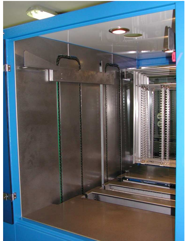
- Transfert automatique des outillages -