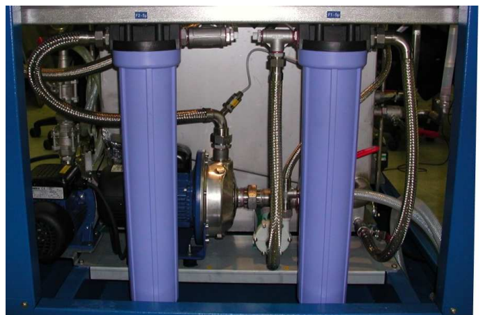
- Système de filtration breveté -