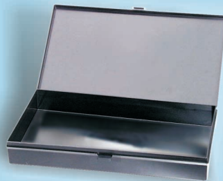
7805.523 int. 288x156x38mm