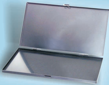
7805.522 int. 288x156x16mm