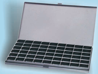
7805.525 avec 54 alvéoles de 28x27x15mm