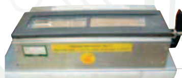
BE 300X50 SEP : exemple de possibilité de séparation en 2 du creuset d'un bain BE300X50 ou 90