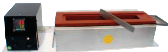
BE 300X90 : grande capacité (idem BE300X50)