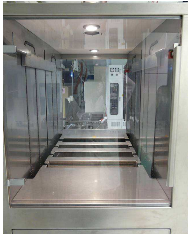
- Transfert automatique des outillages -