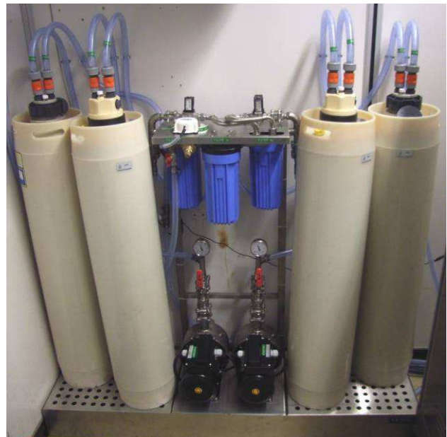
- Station de régénération eau DI en option -