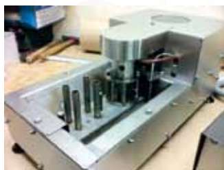
MV buse multi : minivague MV400 avec une buse multijets