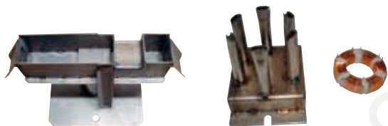
Exemples de buse sur mesure

Les Mini-Vagues sont aussi des machines de productions pour brasage de composants complexes nécessitant des buses adaptées multi-jets.