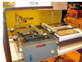
MV500 mini vague avec système montée/baisse et table de translation x,y