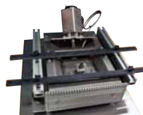
MV100 mini vague avec posage PCB